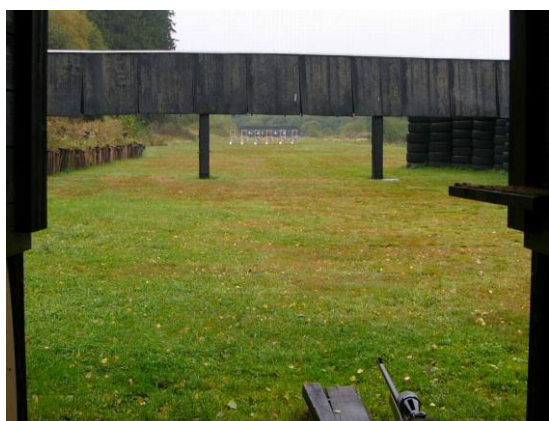
Obr. 4 Střelnice Světnov

Obec Světnov a její vedení se samozřejmě snaží přispět a vést obyvatele ke sportu a aktivnímu vyžití pomocí sportovně kulturních tradic během celého roku. Tyto tradiční akce jsou organizovány většinou Sbořem dobrovolných hasičů obce Světnov, kdy se jedná o různé sportovní akce jako např. lyžařské závody, dětský karneval, hasičský ples apod. Sbor dobrovolných hasičů má vlastní sportovní oddíly: mladší žáky, starší žáky a dorost, kteří se věnují požárnímu sportu. V obci dále působí HC Světnov, kdy hokejový klub hraje tzv. Vesnickou ligu hokeje. Dalším klubem působícím v obci je SK Světnov, kdy se jedná o klub hráčů stolního tenisu. Klub je rozdělen na SK Světnov A a B, kdy skupina A hraje okresní přebor IV. třídy a skupina B okresní přebor V. třídy. V rámci stolního tenisu zde působí ještě jeden klub, a to Vlci Světnov, kteří se účastní přeboru Vysočiny, ligy neregistrovaných hráčů. Dalším spolkem v obci Světnov jsou světnovští Ochotníci, kteří již 11 let připravují divadelní představení a přispívají k sportovně kulturním aktivitám obce. V neposlední řadě na okraji obce Světnov je také střelnice, kde působí Českomoravská myslivecká jednota z.s. jež podporuje a rozvíjí sport pro lovce a myslivce ( http://www.strelnice.net/ ).