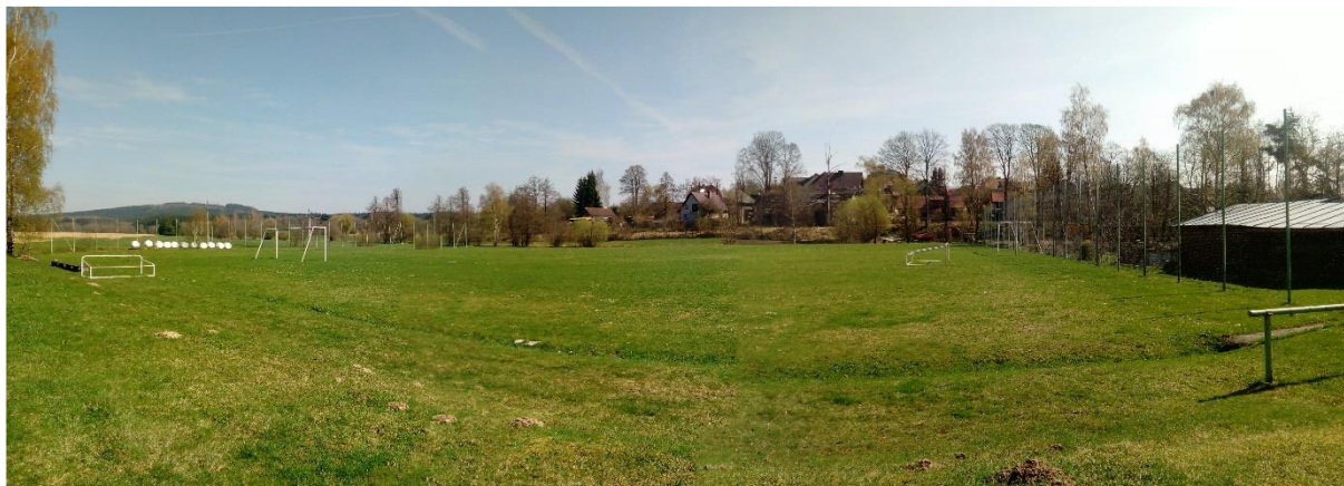
Obr. 1 Fotbalové hřiště

Podmínky a zázemí pro rozvoj sportu v obci Světnov jsou především postaveny na fotbalovém hřišti, které je v obci již několik desítek let. Fotbalové hřiště bylo upraveno sportovním klubem především v letech 1996-1997, kdy dnešní podobu získalo v roce 2000. V souvislosti s fotbalovým hřištěm samozřejmě v obci dlouhodobě působí fotbalový klub AC Světnov, kde trénují fotbalisti na zápasy ve Žďárské lize – malé kopané ( https://acsvetnov.webnode.cz/ ).